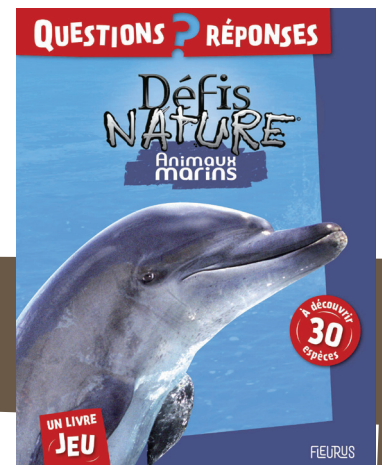
Animaux marins Emmanuelle Figueras