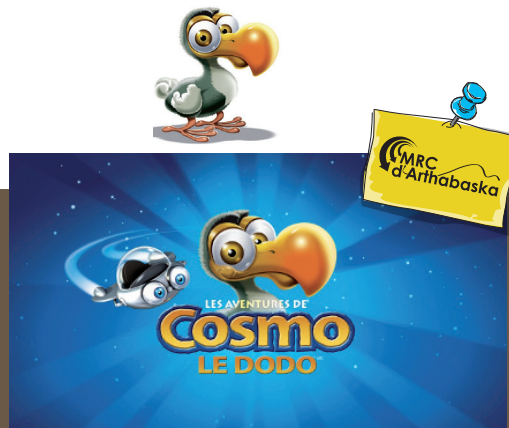
Les aventures de Cosmo, le dodo Titres variés de Joannie Beudet